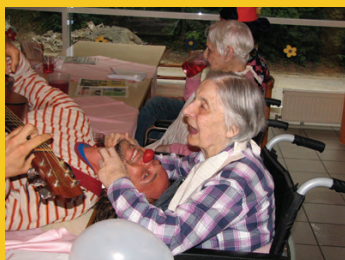
Die Klinikclown Gruppe „Einherz-Clowns“ zu Besuch bei den BewohnerInnen der Kursana Residenz Wien-Tivoli