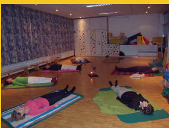
© Petra Kain - DO-IN Gruppe

2008 erhielt ich die Möglichkeit, über Health Consult, Gesellschaft für Vorsorgemedizin Ges.m.b.H., den MitarbeiterInnen der Caritas Socialis DO-IN Kurse anzubieten. Mittlerweile erfreuen sich die Kurse einer großen Beliebtheit. Seit Anfang 2010 wird DO-IN bereits an zwei Standorten für die CS MitarbeiterInnen angeboten. Eine Mitarbeiterin des Pflege- und Sozialzentrums in der Pramergasse berichtet, dass DO-IN ein großer Gewinn für sie sei, weil sie bestimmte Übungen in ihren Alltag gut integrieren könne und auch die Tagesgäste davon profitieren, da sie diesen auch passende Übungen vermittele. Eine andere DO-IN Teilnehmerin schildert, dass die Übungen ihr helfen, sich zu entspannen. Sie fühle sich nach einem Kurs beweglicher und ausgeglichener und sie gehe jedes Mal mit einem entspannten und lockeren Gefühl nach Hause. Es gelinge auch sehr gut vom Alltag abzuschalten, erzählen immer wieder auch andere Teilnehmerinnen. Häufig wird mir von den Übenden rückgemeldet, dass sich nach einer Einheit (1 ½ Stunden) ein positives Gefühl einstellt und das Wohlbefinden noch lange anhält.