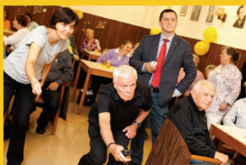
„Bowling im Klub – mit Wii“

Das Projekt startete in der zweiten Jahreshälfte 2010 in zwei Pensionistenklubs der Stadt Wien: In der Rotenhofgasse (10. Bezirk) und in der Marchfeldstraße (20. Bezirk). Mehrmals pro Woche standen gesundheitsförderliche Aktivitäten auf dem Programm. Dazu zählten Ernährungsworkshops und spielerische Bewegungseinheiten ebenso wie Tanzveranstaltungen. Ausgewählt wurden die Angebote von den Seniorinnen und Senioren der beiden teilnehmenden Klubs selbst. Denn nur wenn die Klub-Besucherinnen und –Besucher die Aktivitäten in erster Linie als ihr eigenes Projekt betrachten, werden sie auch langfristig mitmachen.