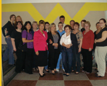
Kursgruppe im Wilheminspital

überzeugte dann das Konzept der Firma Weight Watchers durch eine professionelle Betreuung der Gruppe für 12 Wochen vor Ort und der Philosophie einer Ernährungs- und Verhaltensumstellung.